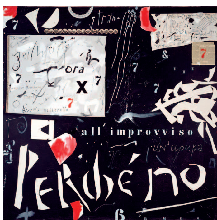
Rudolf Mumprecht: Perché no, 1992

Sous le titre „ zwischen den Worten - entre les mots - fra le parole „, l'exposition traite de l'espace de l'écriture artistique de Mumprecht - qui ne se laisse confondre avec aucune autre - et s'attache à mettre en lumière les principes de composition de ses images. L'espace est ici entendu aussi bien au sens d'espace poétique que d'espace plastique.