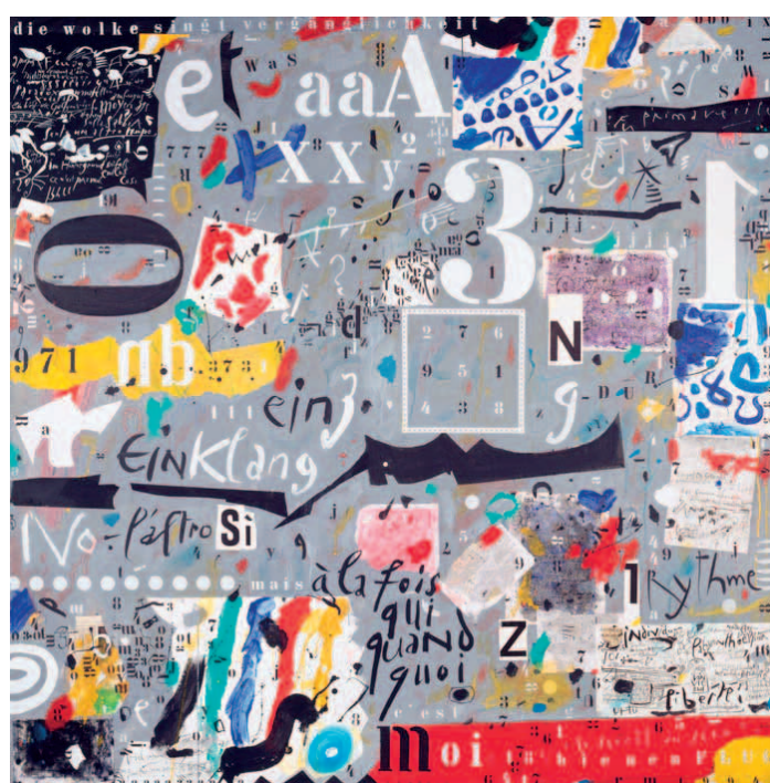
Rudolf Mumprecht: die Wolke singt Vergänglichkeit, 1994

Mumprecht suivit toujours sa propre voie. A la différence de Cy Twombly qui s'intéressa lui aussi à l'image, à l'écriture, à la langue et aux signes graphiques, ce n'est pas dans les récits mythologiques que Mumprecht cherche l'origine de la créature, ou de ce qui constitue l'être humain, mais dans la nature. Rudolf Mumprecht entretient une relation intense avec la vie et transpose ses perceptions dans des peintures d'écriture. Celles-ci dégagent une irrésistible force d'attraction et des mots tels que „Zeit„ (Temps), „Liebe„ (Amour), „Hoffnung„ (Espoir) ou „Einklang„ (Harmonie) s'impriment durablement dans la mémoire sensorielle des spectateurs.