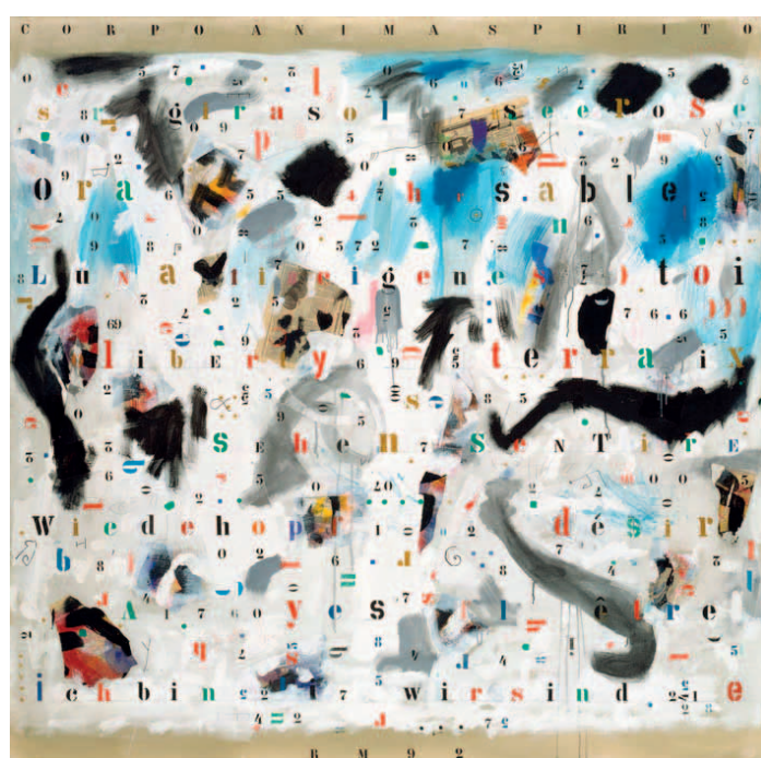
zwischen den Worten - entre les mots - fra le parole - Hommage à Mumprecht

Rudolf Mumprecht: Corpo Anima Spirito, 1992